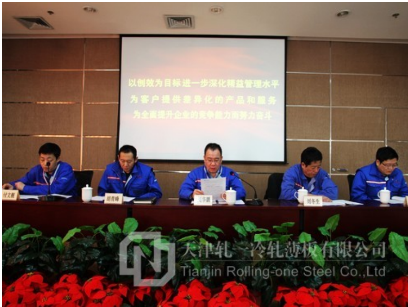
冷板公司首届七次职代会主席台