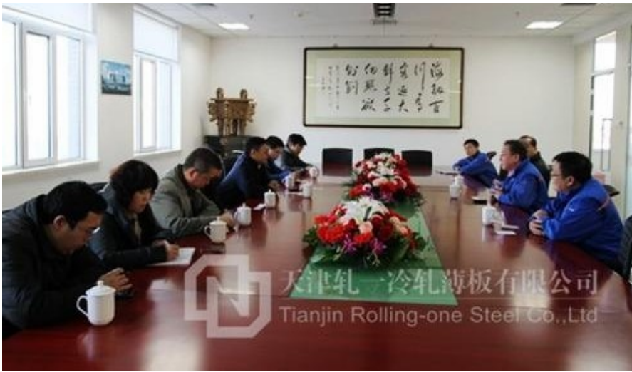
格瑞夫代表团到冷板公司参观