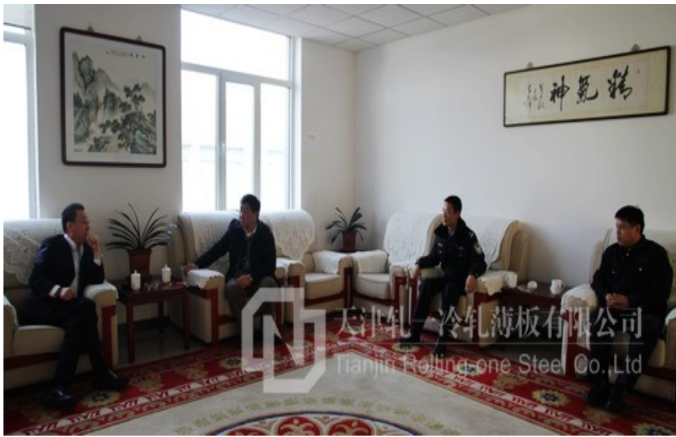
公安滨海新区大港分局领导到公司检查工作