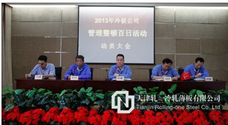
冷板公司召开管理整顿百日活动动员会