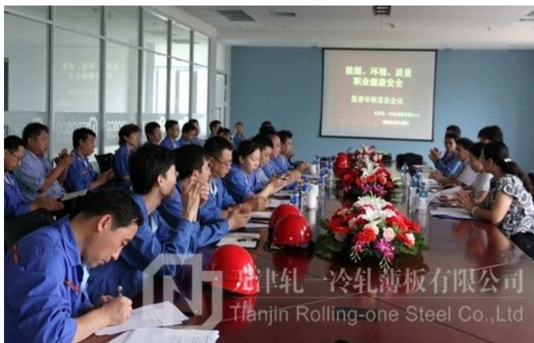
体系监督审核首次会议现场

8月28日，冷板公司召开2013年体系监督审核会议，接受来自北京国金恒信管理体系认证有限公司审核专家组的指导和检查。此次审核为期三天，审核专家组将对冷板公司能源、环境、质量、职业健康安全等部门进行审核，以评价冷板公司开展体系工作以来的适宜性、充分性和有效性。冷板公司各部门领导及相关受审人员将在三天时间里积极配合监督审核工作，通过自我完善，持续改进，促进公司管理水平的不断提高。