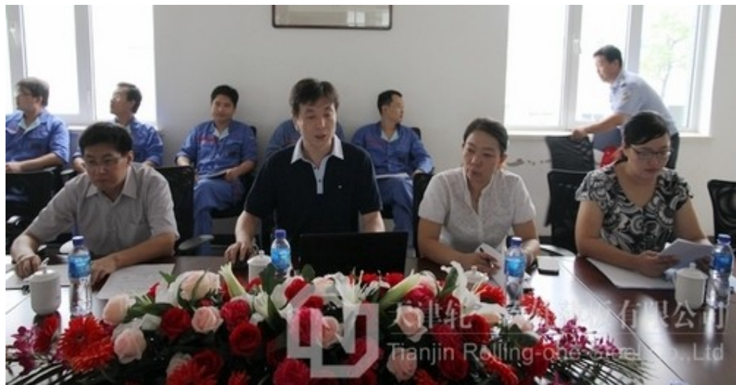
北京国金恒信管理体系认证有限公司审核专家组