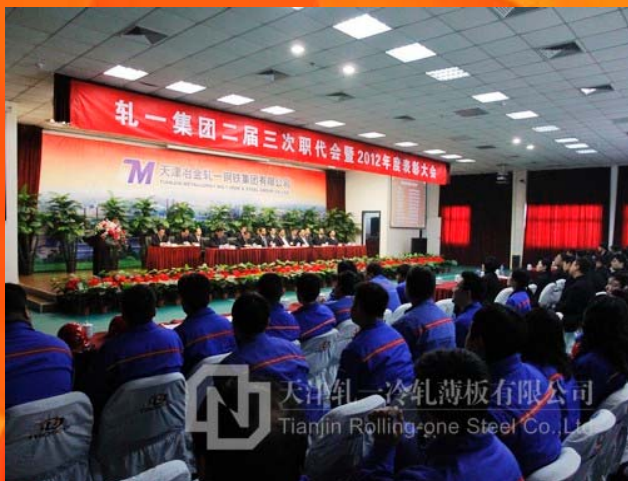
轧一集团二届三次职代会会场