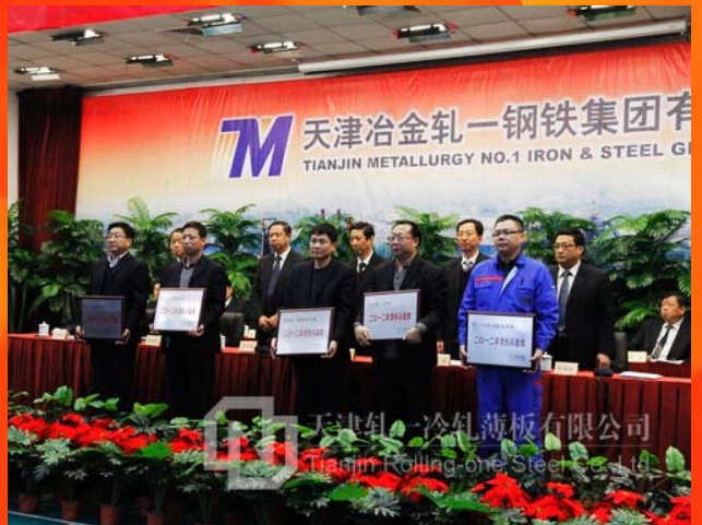
2012年度集团技术创新标兵集体