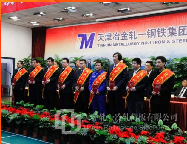
2012年度集团技术创新标兵个人