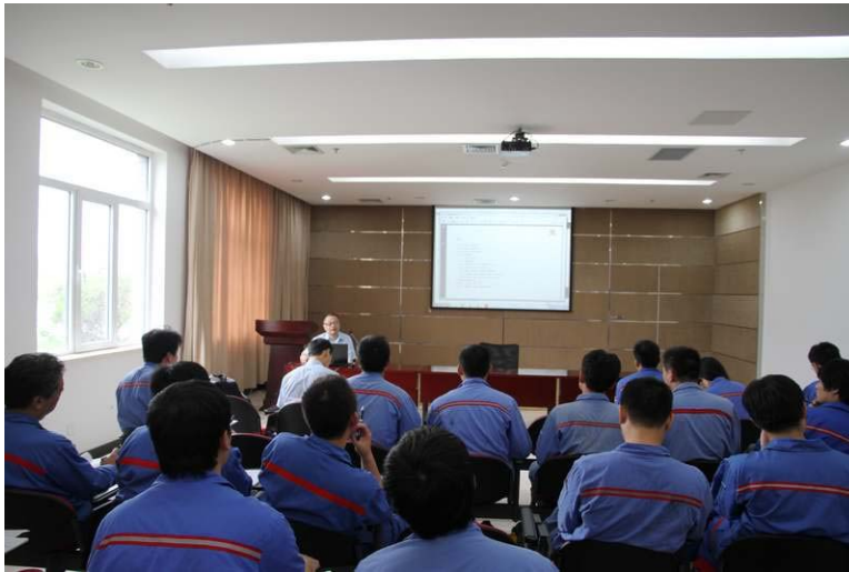
三宜油化专家为我公司职工进行培训指导

2012年9月7日、9月8日轧一冷板特请来三宜油化股份有限公司两位资深专家到我公司进行为期两天的技术指导及培训交流，此次培训交流以现场分析指导、授课讲解、问题解答的形式，