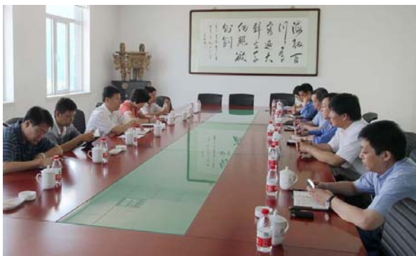
安全督查会议现场