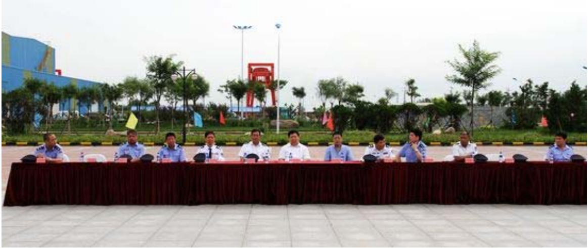
集团公司第二届保卫大练兵大比武预演主席台