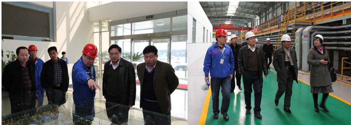
刘总为督查四组组长，市监察局领导介绍公司建设、生产及扩建情况