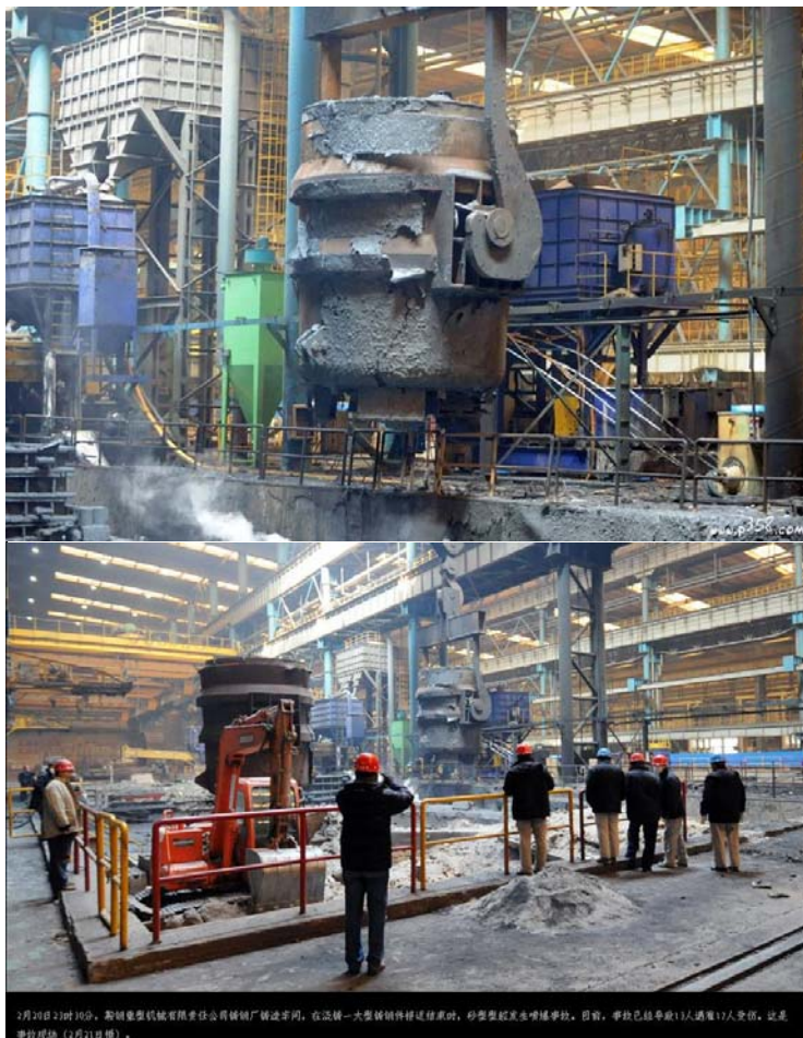
2月21日23时10分，鞍钢重型机械有限责任公司铸钢厂铸造车间，在浇铸一大型铸钢件接近结束时，砂型型腔发生喷爆事故。目前，事故已导致11人遇难12人受伤。这是事故现场（2月21日摄）。

中新网3月5日电 中央纪委驻国家安全监管总局纪检组长、总局党组成员赵惠令日前率国务院安委办第六督导调研组在福建省督导调研安全生产工作时要求，深入开展隐患排查治理和重点行业领域安全专项整治，要深刻吸取近期在山西发生的重大交通事故和在辽宁鞍钢发生的砂型型腔喷爆重大事故教训，举一反三，严防类似事故发生。