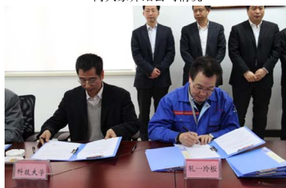
冷板公司与科技大学等签署了四项结对支持合作意向书